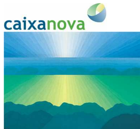
Lodeiro (paisaje) Colección Caixanova