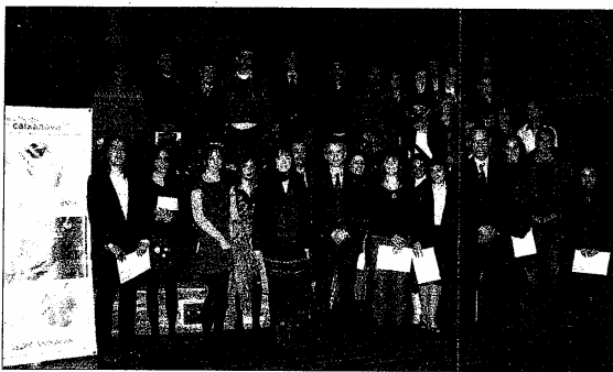
El director general de Caixanova en la entrega de los diplomas de las becas 2009

La importancia de la moda gallega vivió una especial eclosión en los años 80 y este momento tan especial se rememora ahora en el Pazo da Cultura de Pontevedra con la muestra Oe 80, moda en Galicia. Singularidades , una interesantísima iniciativa que está patrocinada por Caixanova.