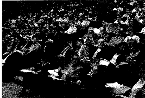
Las Jornadas vienen precedidas por un importante éxito de asistencia en ediciones anteriores

yor información o realizar su inscripción pueden dirigirse al teléfono 986 81 55 16 o descargar el boletín en la página web www.caixanova.es para remitirlo cubierto a la dirección de correo electrónico mbellosouto@deloitte.es .